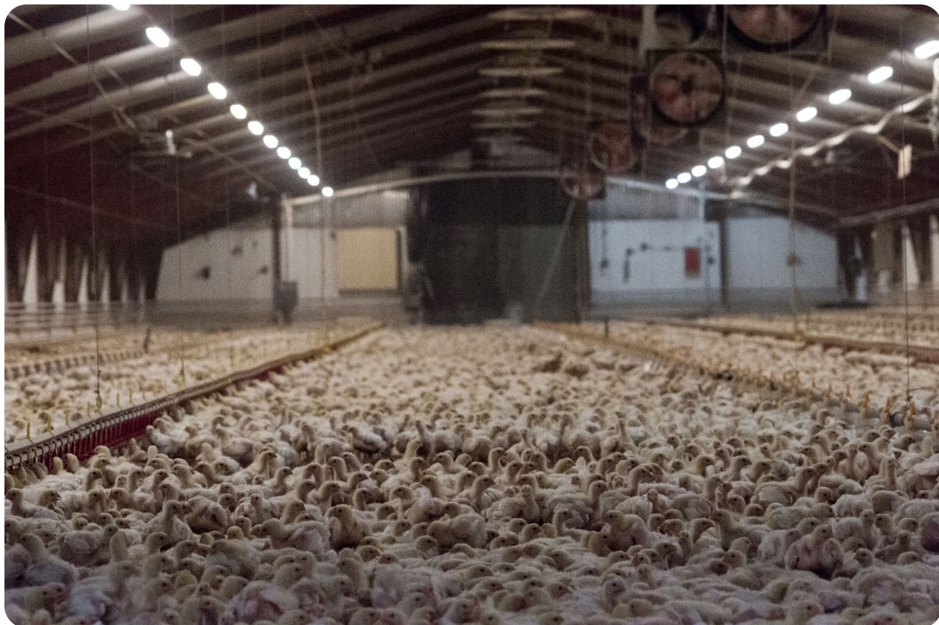
Turbokyllinger holdes i store haller der de lever tett i tett. Omtrent 18 stk deler én kvadratmeter.