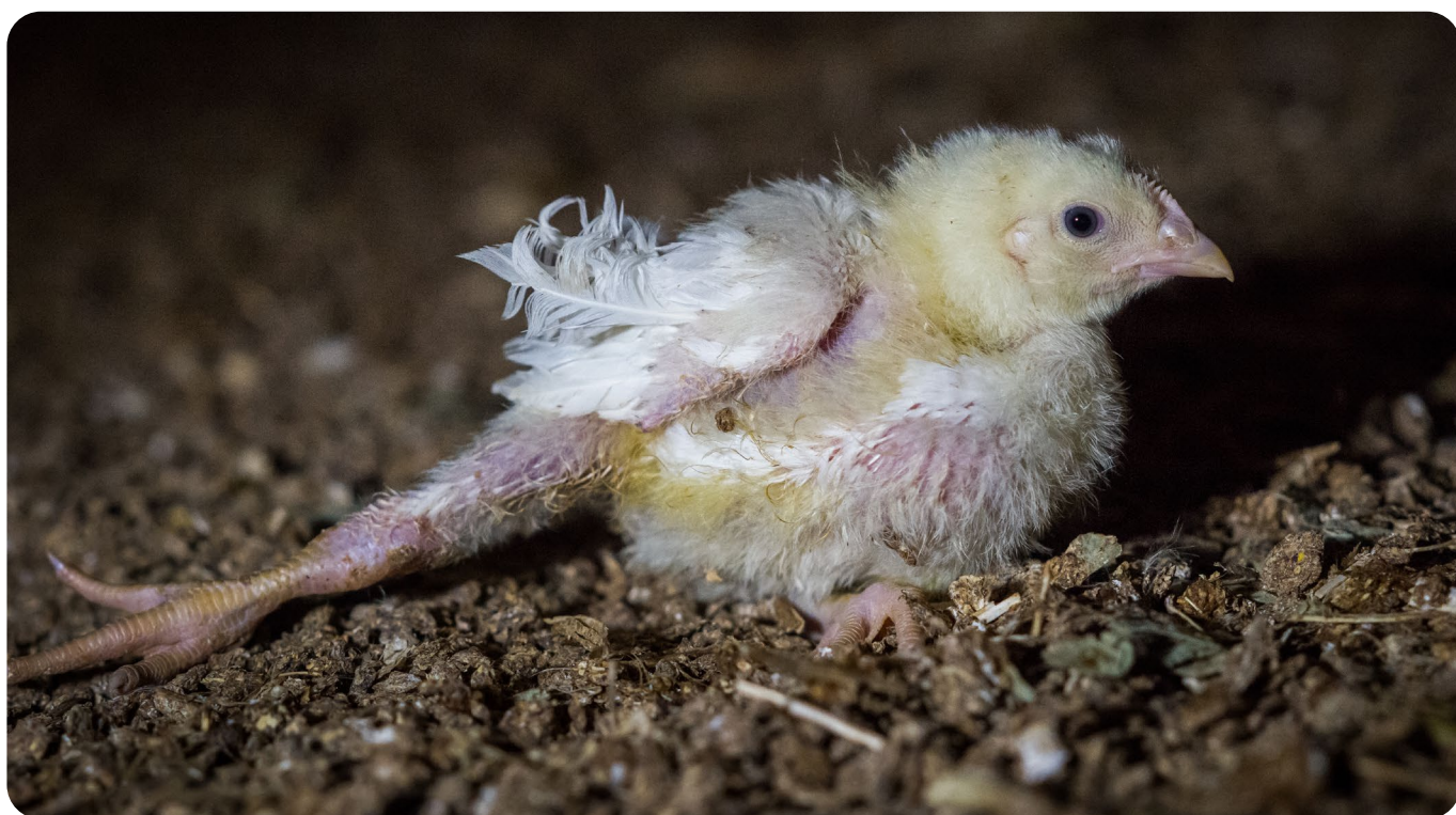
Turbokyllingene lider i stor grad av helseplager, og over ni av ti har problemer med å gå normalt.